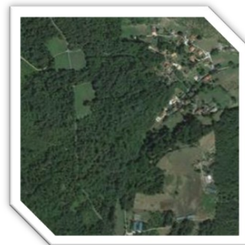
Carte satellite Grun-Bordas

Ce numéro s'est intéressé à la forêt qui constitue un des éléments immuables des paysages.