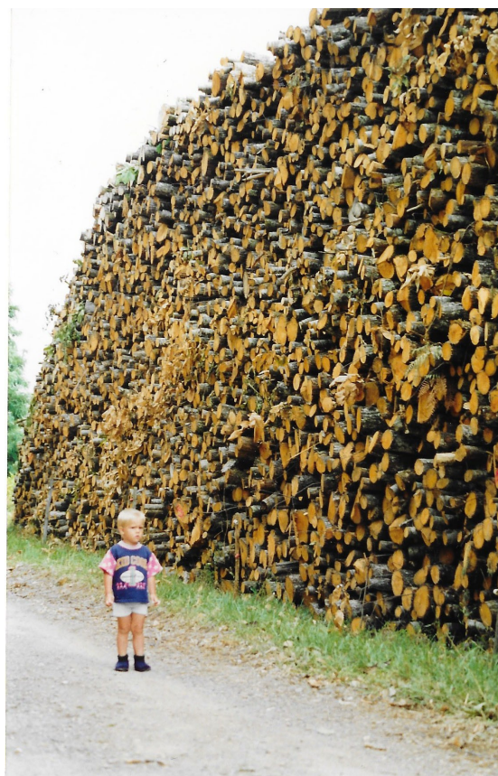
Charly petit-fils de la compagne de M. DEKENS devant la première coupe de l'exploitation.

Après tout, près de 127 000 arbres plantés en 33 ans, ça se respecte !