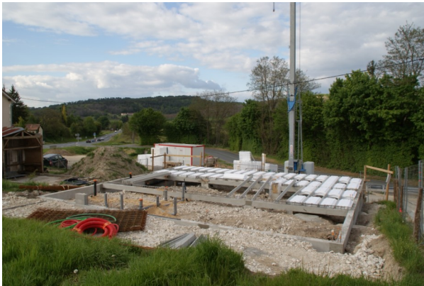
28 avril 2017