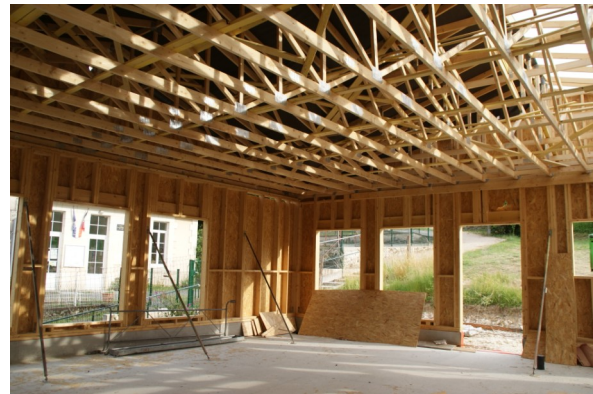
23 juin 2017