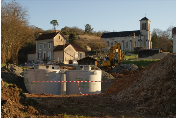
16 mars 2017