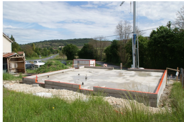
12 mai 2017