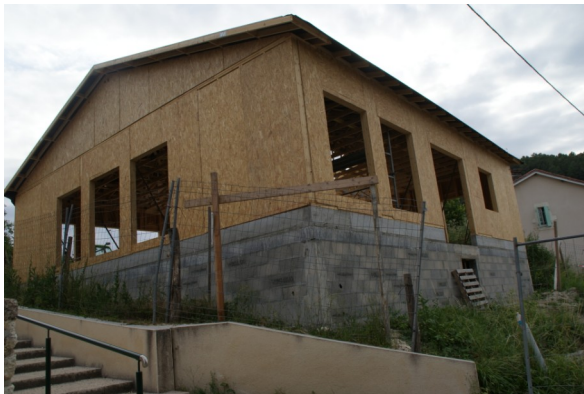
23 juin 2017