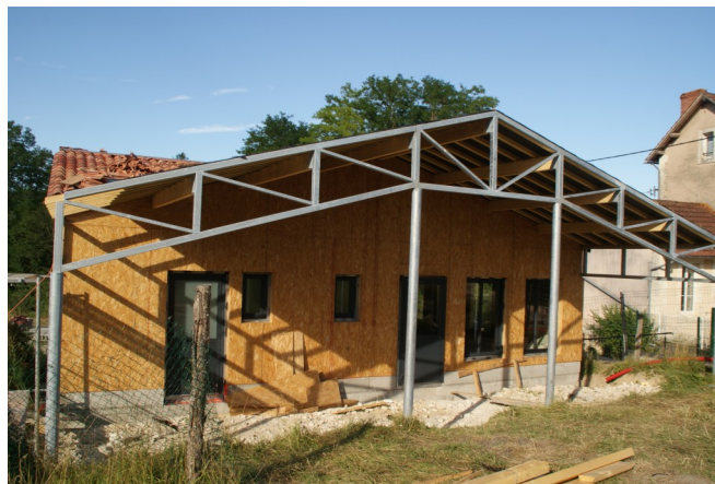
13 juillet 2017