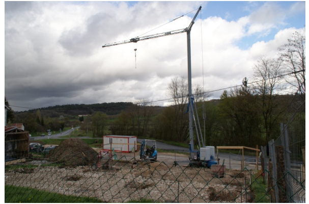
1er avril 2017